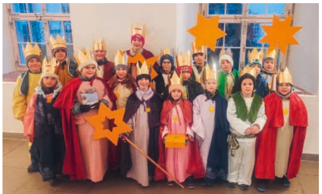
Impressionen Sternsingen im Oberen Toggenburg